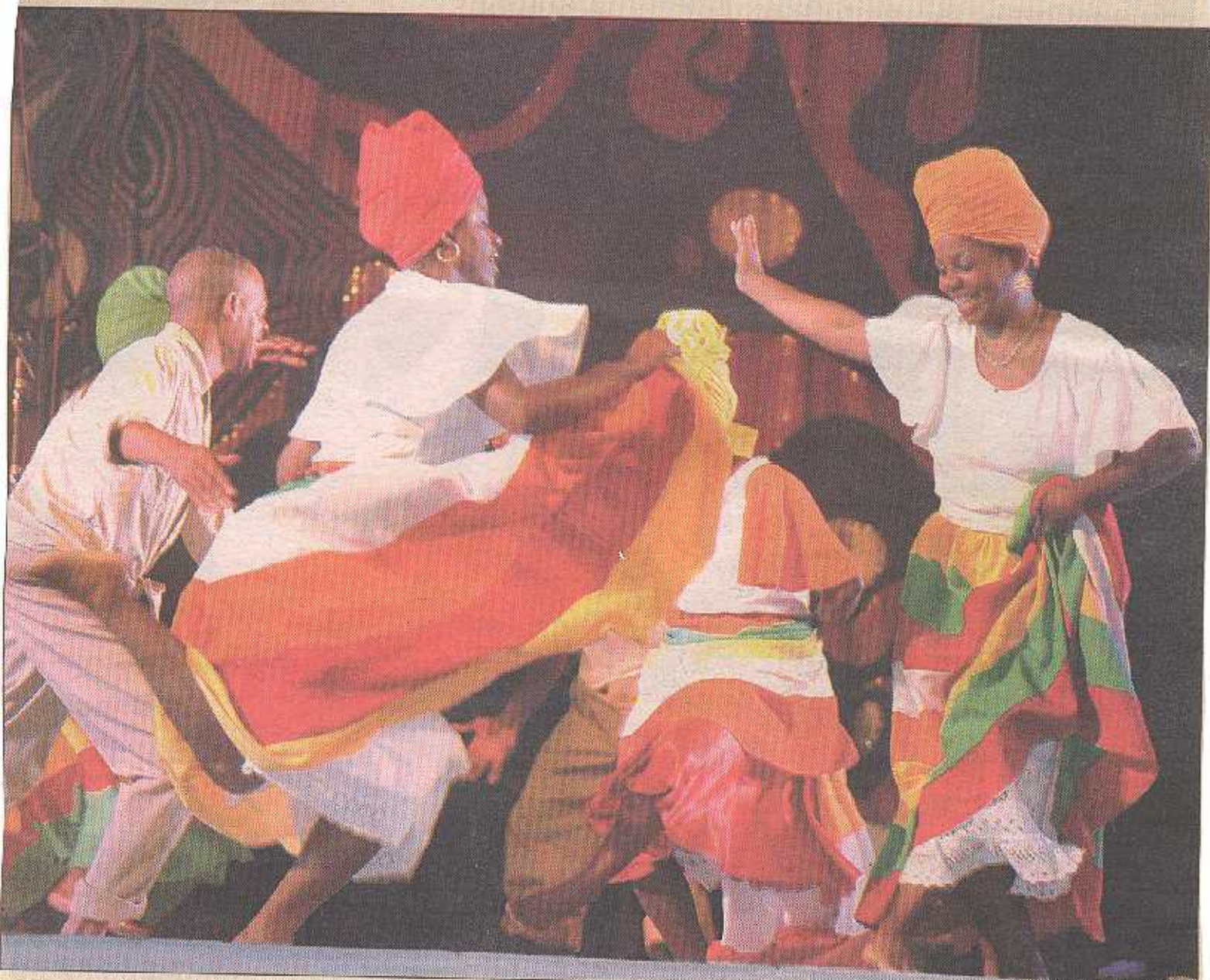
Folk dancers perform on Wednesday night at Queen's Park Savannah in Port-of-Spain, during the opening ceremony of the Emancipation Lidj Yasu Omowale Village. The ceremonial opening was hosted by the Emancipation Support Committee.